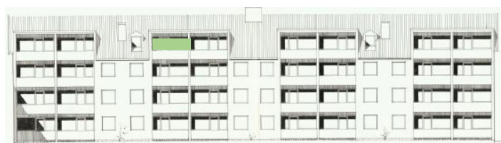
Vy mot söder