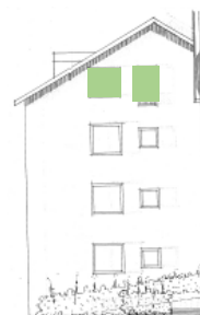
Vy mot väster