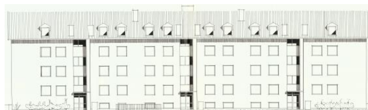
Vy mot norr