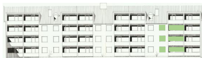
Vy mot söder