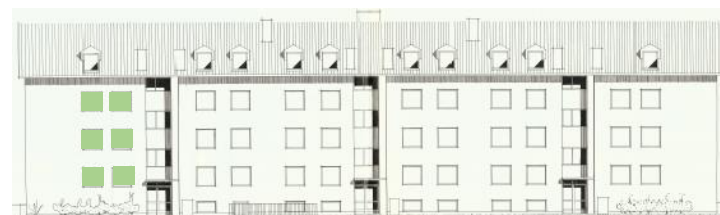
Vy mot norr