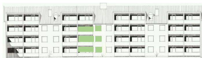
Vy mot söder