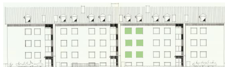
Vy mot norr