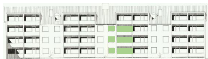
Vy mot söder