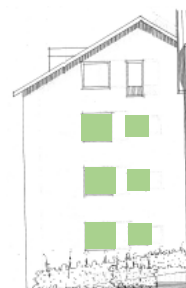
Vy mot väster