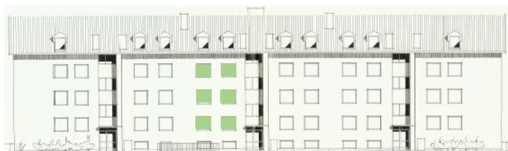
Vy mot norr