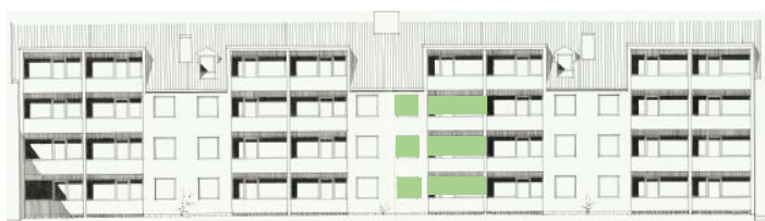
Vy mot söder