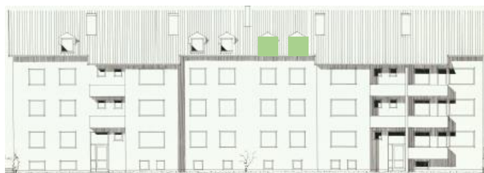
Vy mot öster