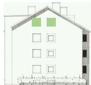
Vy mot söder