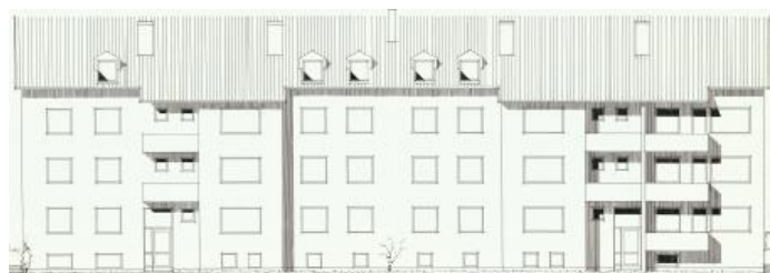
Vy mot öster