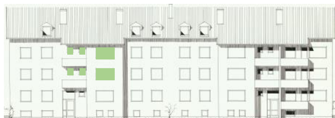
Vy mot öster