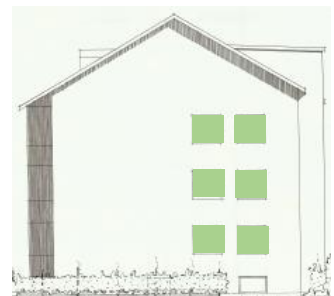
Vy mot norr