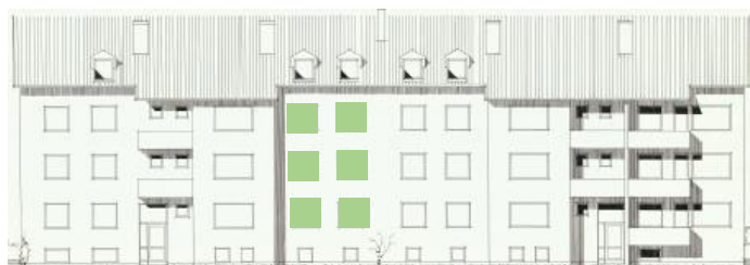
Vy mot öster