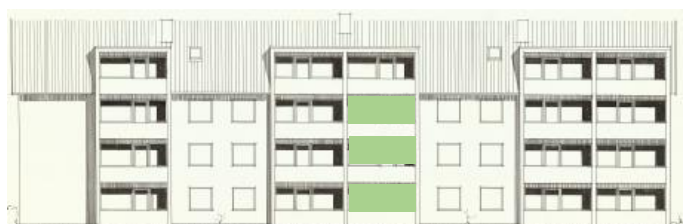
Vy mot väster