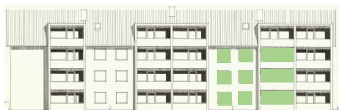
Vy mot väster