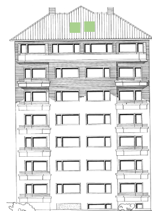
Vy mot syd