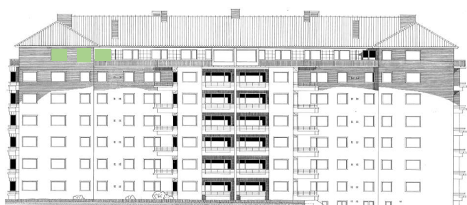
Vy in mot gården (väster))