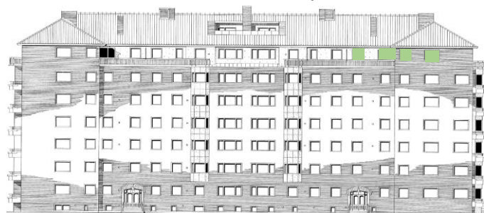
Vy längs Sergelsväg