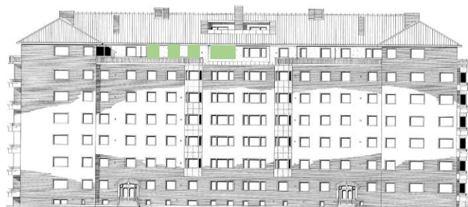
Vy längs Sergelsväg