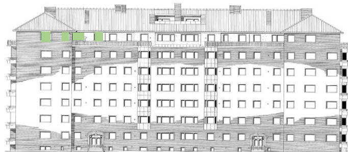
Vy längs Sergelsväg