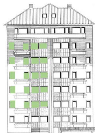
Vy mot norr