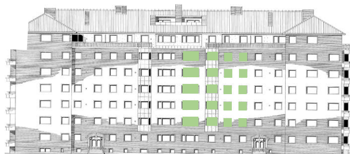
Vy längs Sergelsväg