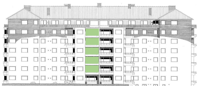
Vy in mot gården (väster))