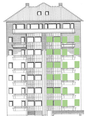
Vy mot norr