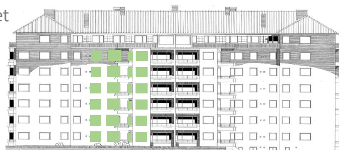
Vy in mot gården (väster))