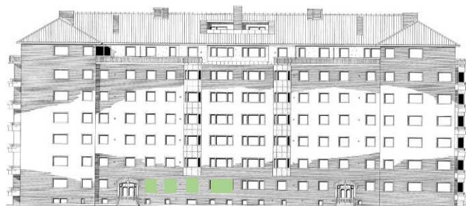
Vy längs Sergelsväg