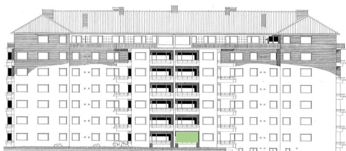
Vy in mot gården (väster))