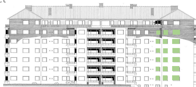
Vy in mot gården (väster))