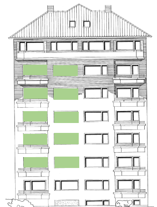
Vy mot syd